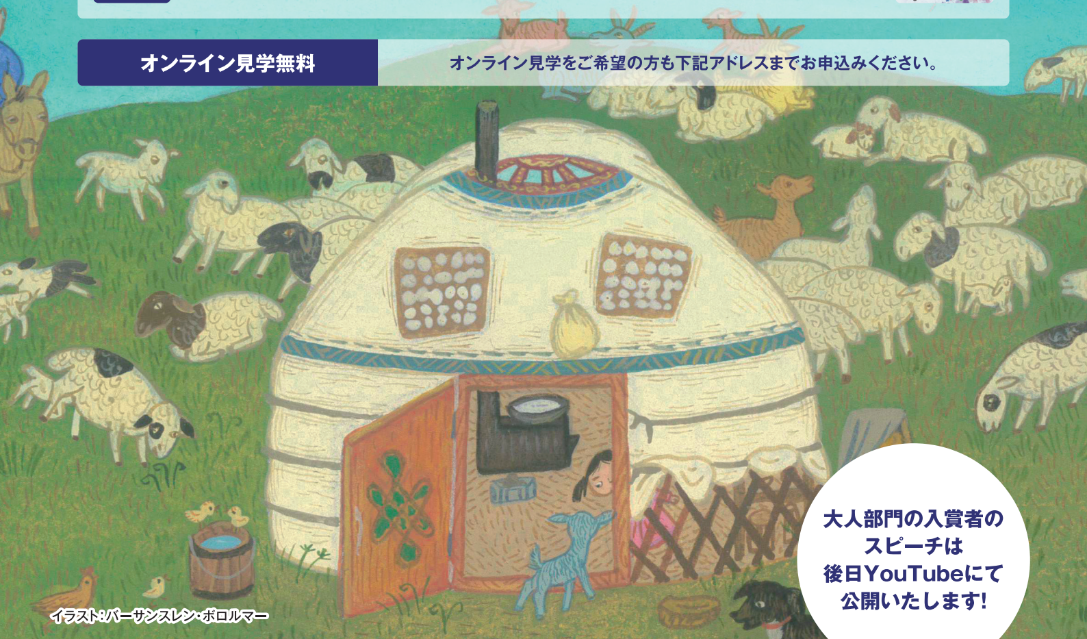
イラスト:パーサンスレン・ボロルマー